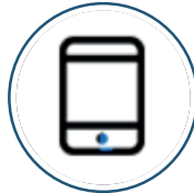
Control por APP